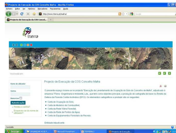
Fig: PAP – página de acompanhamento do projecto